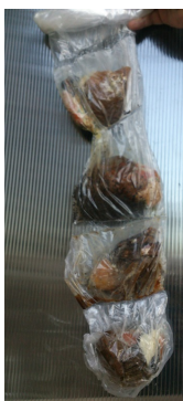
Figur 1. Matavfall och mänskligt avfall kommer att förseglas hygieniskt och utan förluster som med nuvarande metoder medför föroreningar av luften och vatten. Korta transporter till biogasanläggning ska ske med lätta elfordon.

CFW-BAS (Collecting Food Waste-BAS) och CC-BAS (Collecting Closet-BAS) kommer att förhindra förlust av bioenergi och växtnäringsämnen och möjliggöra hygienisk arbetsmiljö för alla involverade i avfallskedjan. Från användare där avfall uppstår, under transport, i biogasanläggningen och vid användning av biogas och biogödsel.